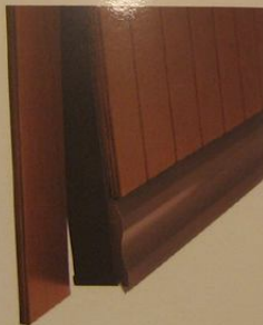
Particolare zoccolo con guarnizione inferiore.